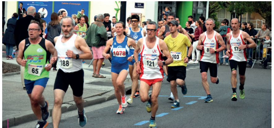
10 KM. La dernière édition en 2019 avait rassemblé 413 adultes et 430 scolaires

Traditionnellement, la course des 10 km du Coteau se joue le dernier vendredi de mai. Cette année, trois nouveautés marqueront l'édition 2021. Une date inhabituelle fixée en octobre, un parcours inédit et un nouveau président pour le Club Athlétique Roannais (C.A.R.).