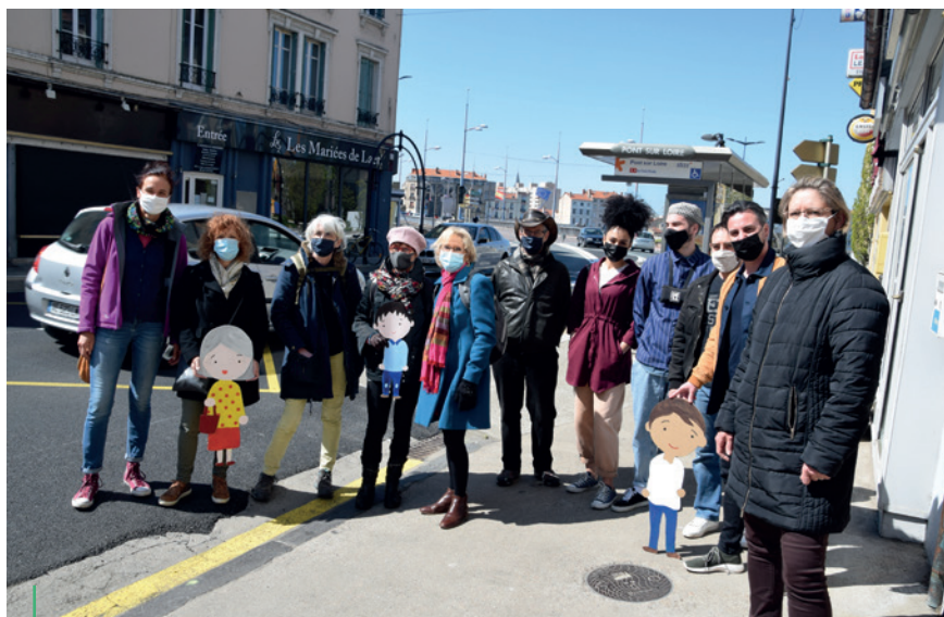
COLLECTIF. La Libellule vous donne rendez-vous au 8 avenue la Libération