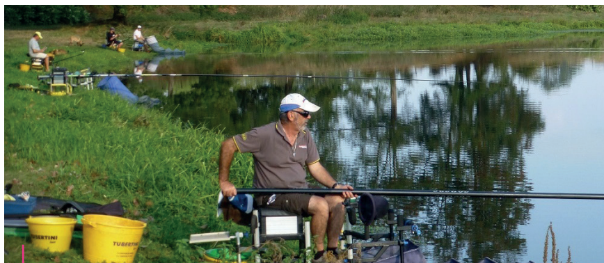
AU BORD DE L'EAU. Les Pêcheurs du mardi à Iguerande

Depuis plusieurs années, la section des Pêcheurs du mardi est la reine des activités. Le rituel est presque sacré et permet aux retraités de se retrouver en toute convivialité. Au gré des semaines et selon le type de pêche - grande canne, feeder, pêche à la carpe - le petit groupe peut poser ses gaules à l'étang de Cornillon,