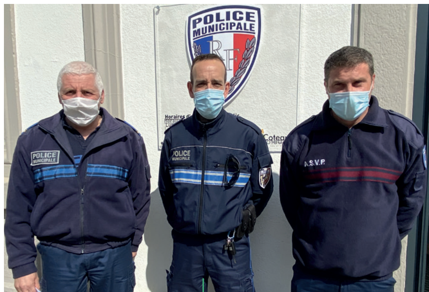
EFFECTIF. Nouveau dispositif de police municipale

Avec l'entrée en fonction d'un nouveau policier municipal, le nouveau dispositif de sécurité au Coteau est pour le moment au complet.