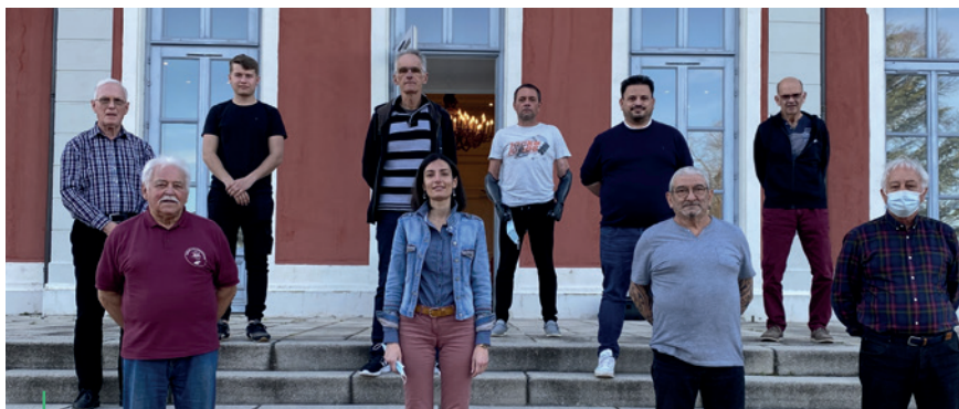
COMITÉ. Les présidents réunis en mairie