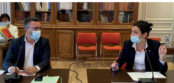
RENCONTRE. Échange à bâtons rompus entre le président d'Agglo et le Conseil municipal

recrutement des licenciés et particulièrement chez les seniors. Les clubs s'adaptent. Certains ont déjà remboursé une partie des licences de la saison, d'autres réfléchissent à des conditions favorables pour la rentrée.