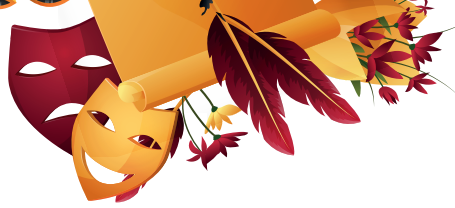
Illustration YOUSTY/Roannais Agglomération