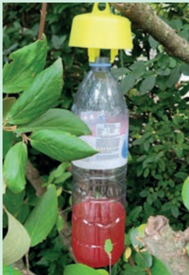
PIÈGE. Frelons asiatiques

Depuis 2022, la ville du Coteau est engagée activement dans la lutte contre le frelon asiatique, véritable fléau pour les abeilles et la biodiversité, mais aussi un danger pour l'homme comme l'a montré une attaque de randonneurs à Renaison il y a quelques mois.