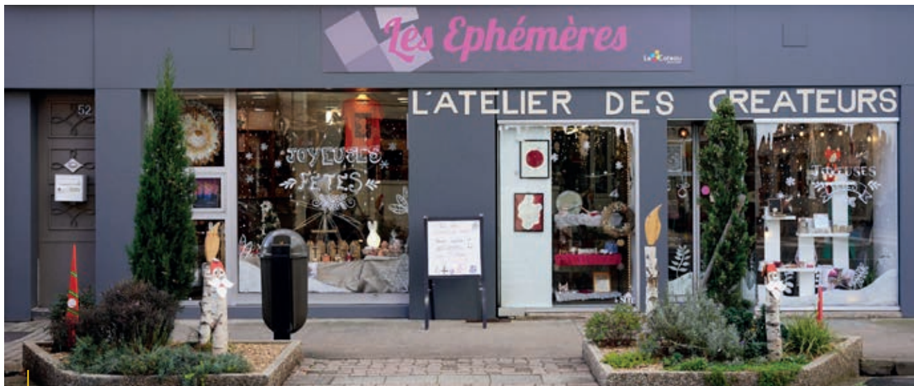
BOUTIQUES ÉPHÉMÈRES. L'Atelier des Créateurs

Après la fermeture de la poissonnerie, un commerce leader avenue de la Libération, la majorité municipale poursuit son action pour soutenir l'activité commerciale de la ville.