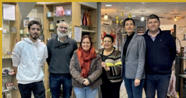
ANNIVERSAIRE. Le maire est venu soutenir les créateurs et commerçants de l'OCA