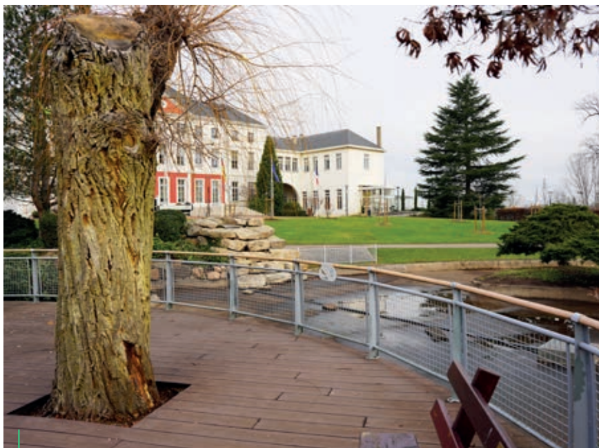
PARC. Le saule au pied du bassin

Le bassin en eau avec ses canards sauvages, ses poissons, ses hérons et autrefois ses cygnes appartient à l'identité du parc Bécot. Au printemps, les travaux de rénovation qui vont être engagés viendront ranger au rayon des souvenirs la mise en assec décidée pour vétusté il y a deux ans.